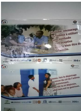
Photographie 3 : Affiche en rapport avec PF le cancer du col de l'utérus