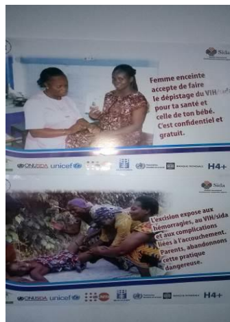
Photographie 4 : Affiche en rapport avec la PTME et l'excision