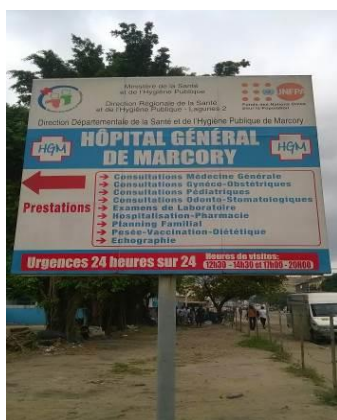
Photographie 6 : Panneau à l'entrée de la structure indiquant la disponibilité des services