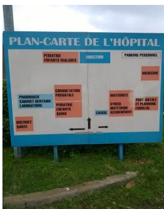
Photographie 7 : Panneau permettant d'orienter les clients vers les services disponibles