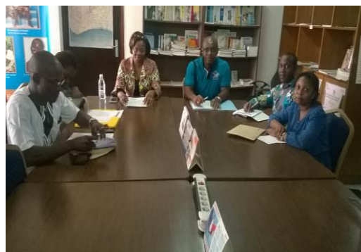
Photographie 1 : Formation des agents de collecte

Cette formation, a permis de passer en revue les différentes questions à poser aux différents responsables en vue de s'assurer de leur compréhension. Des simulations d'interviews ont été également organisées en vue de mettre les agents de collecte en situation réelle de pratique.