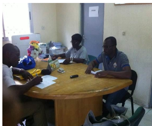
Photographie 2 : Interview avec un responsable et un prestataire d'un PPS

Pour ne pas bouleverser le fonctionnement habituel des points de prestation de service qui ont été visités, les interviews dans ces sites ont été réalisées pendant les heures de pause des prestataires et à l'abri des écoutes et regards indiscrets bien sûr après consentement de ces derniers. A chaque interview, deux agents de collecte ont été mobilisés de manière à ce qu'un agent administre les questions et l'autre assure la prise de note. A la fin de la journée, les agents procèdent à la retranscription des enregistrements et au rapprochement avec les notes prises au moment des interviews. Au total, 6 responsables de point de prestation de service ont été interviewés. Les informations issues de ces entretiens, ont été conservées en fichier électronique et ont fait l'objet d'un traitement manuel par le consultant.